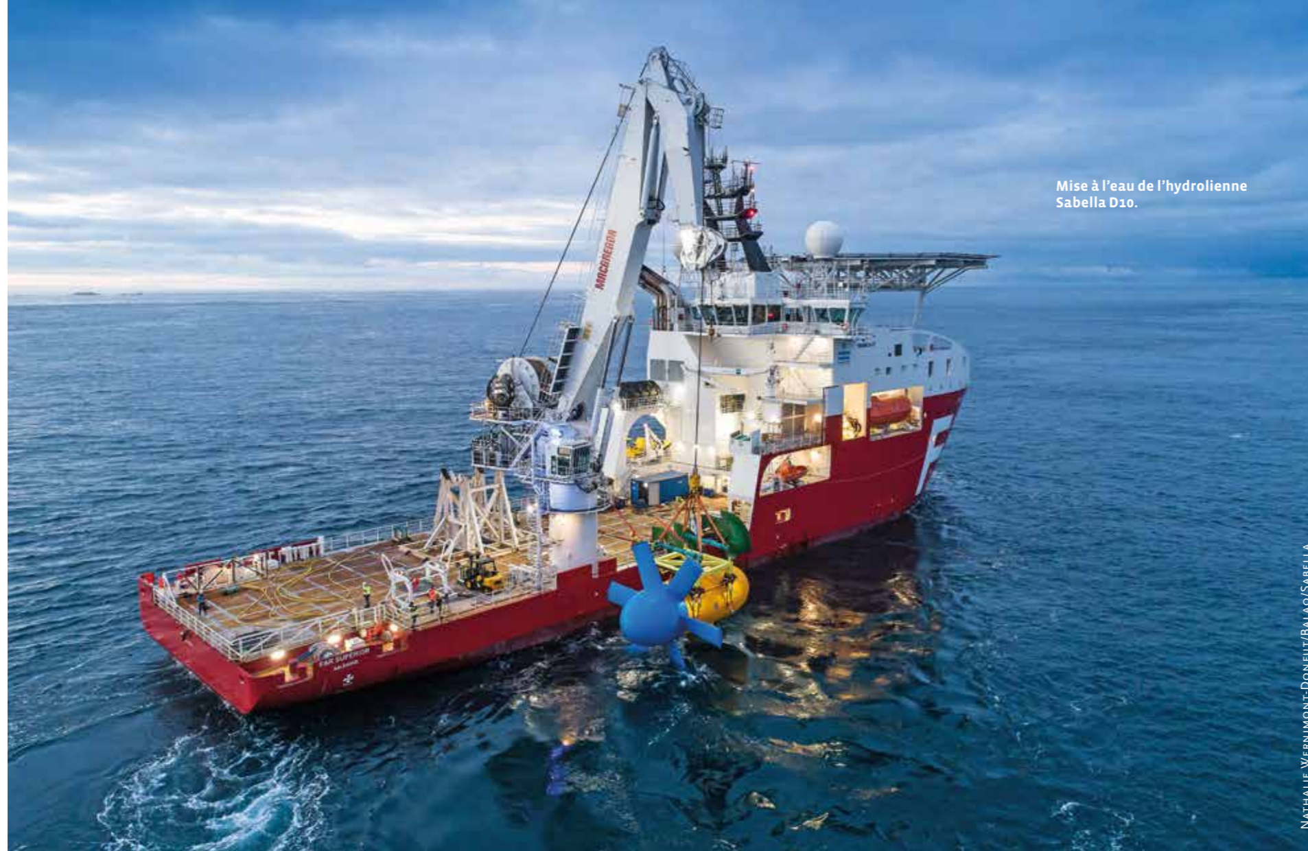
Mise à l'eau de l'hydrolienne Sabella D10.