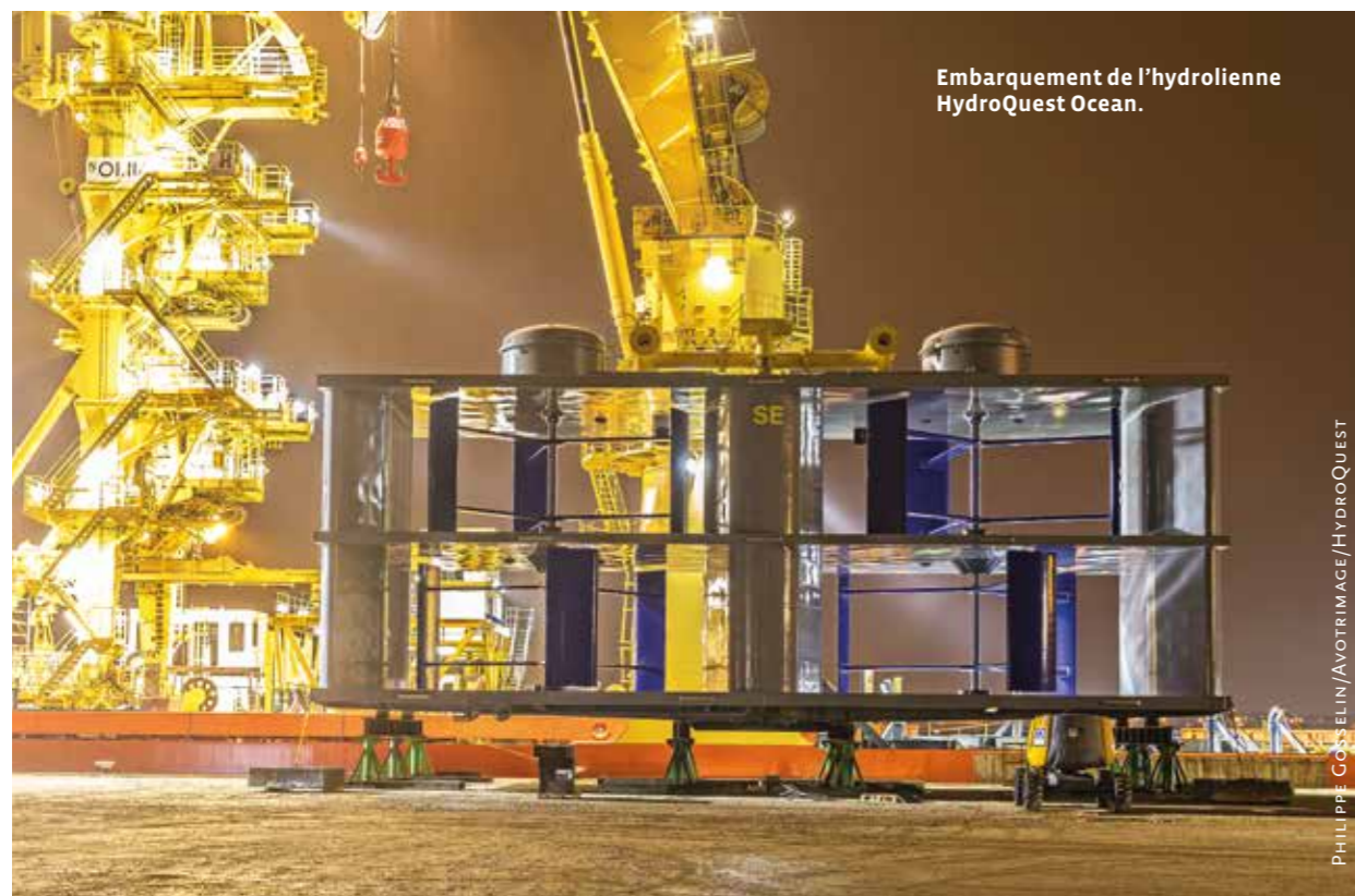
Embarquement de l'hydrolienne HydroQuest Ocean.