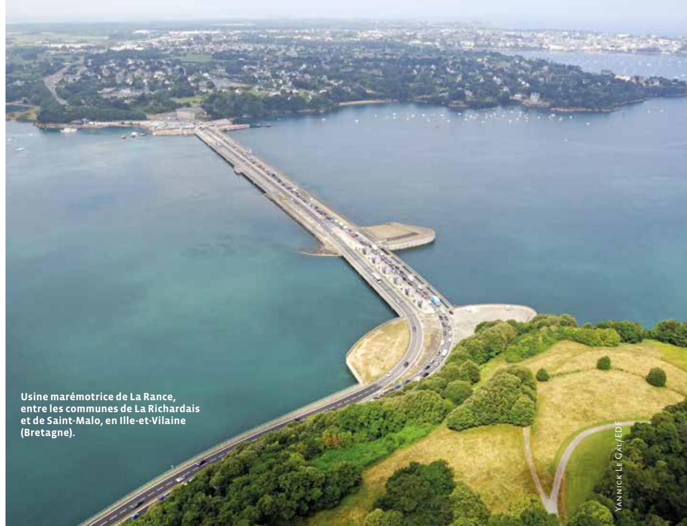
Usine marémotrice de La Rance, entre les communes de La Richardais et de Saint-Malo, en Ille-et-Vilaine (Bretagne).