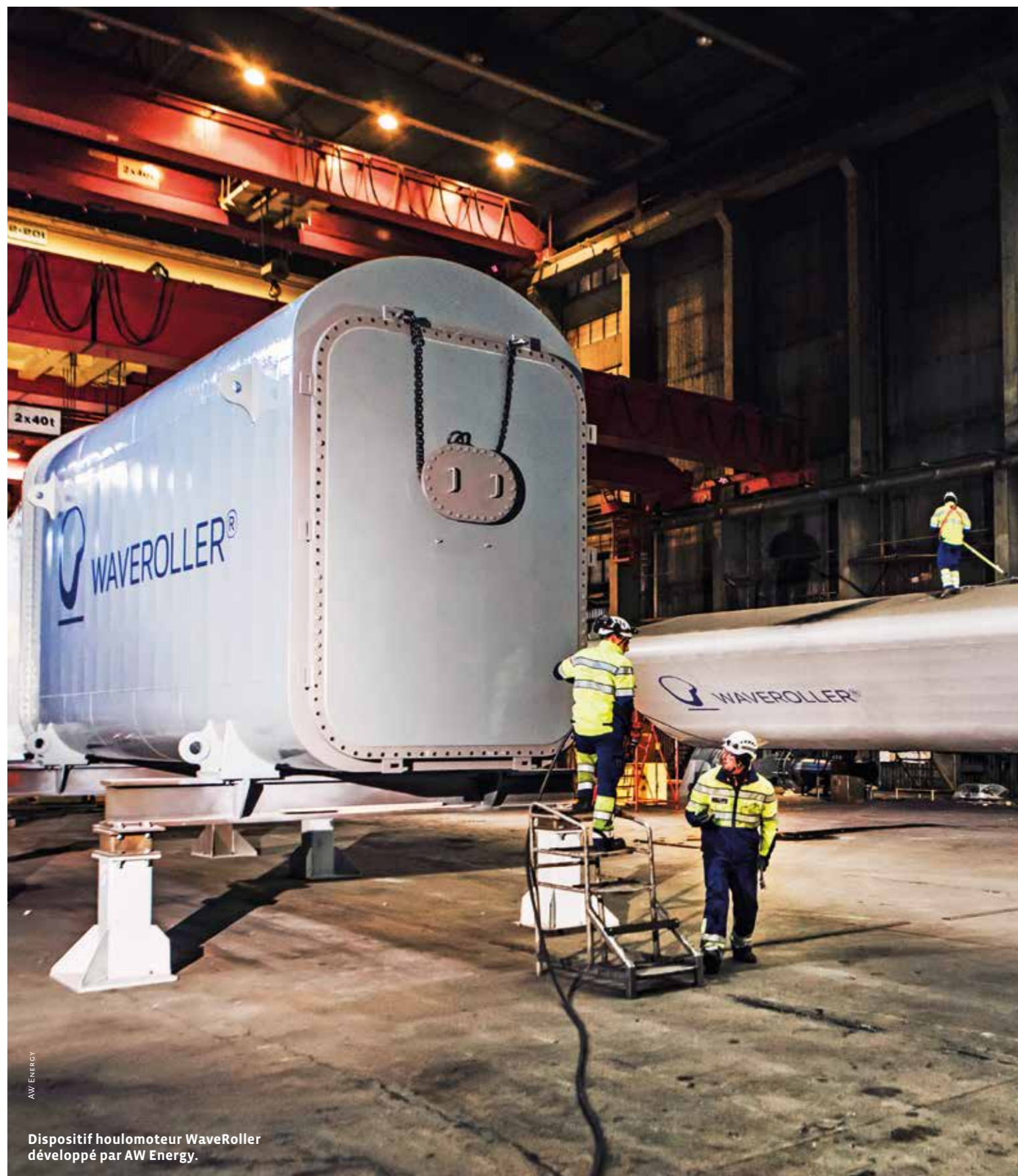
Dispositif houlomoteur WaveRoller développé par AW Energy.