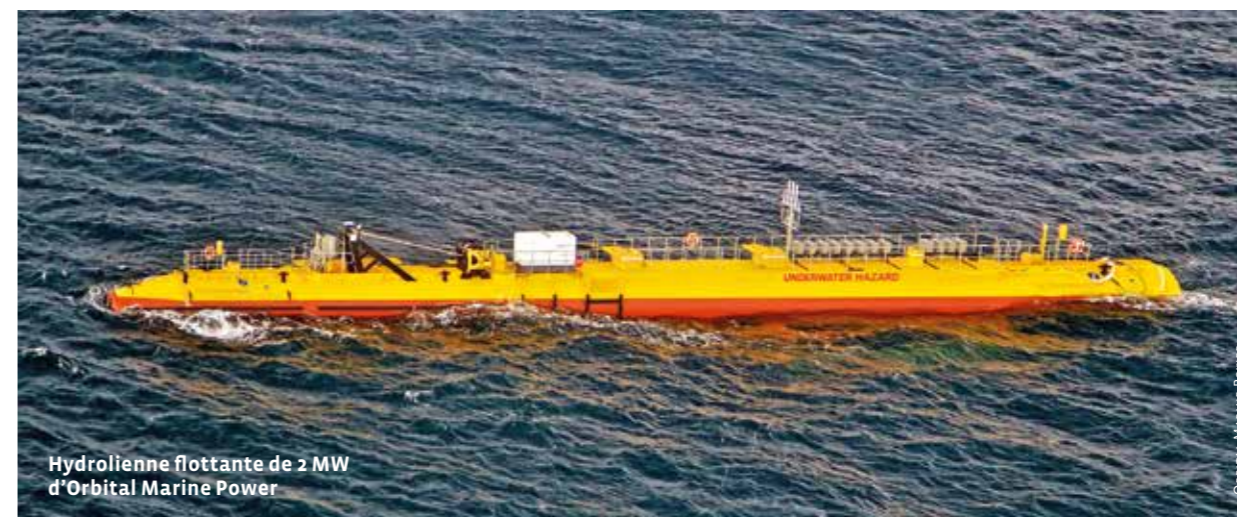
Hydrolienne flottante de 2 MW d'Orbital Marine Power

Si on excepte l'énergie marémotrice, très proche technologiquement des barrages hydroélectriques, les technologies éner-