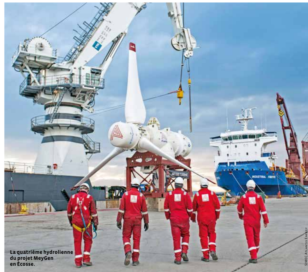
La quatrième hydrolienne du projet MeyGen en Écosse.

(296 kW). Cette centrale est également particulière car c'est la première usine brise-lames au monde utilisant l'énergie des vagues avec plusieurs turbines. La centrale, abritée par une digue, produit de l'électricité grâce à la force des vagues qui viennent se briser dessus. La production d'électricité de ces deux centrales n'est pas publique en raison de la législation espagnole sur la protection des données statistiques, le nombre de projets et la puissance étant trop faibles. Une indication est cependant apportée par le rapport d'information annuel d'Enagás de 2013 qui estime que le régime